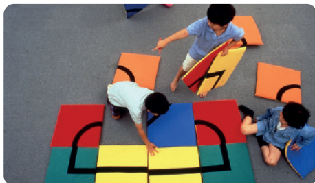
© One Stroke / Katsumi Komagata

Exposition et ouvrages prêtés par la Bibliothèque départementale de la Somme.