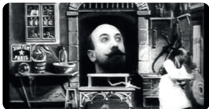
Georges Méliès : L'homme à la tête en caoutchouc

Samedi 16 janvier 2016 - 15 h - 16 h 30 (voire 17 h 30 pour les plus curieux !)