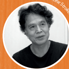
© One Stroke / Katsumi Komagata