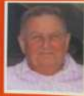
Papi, Maman, Petit, Maman