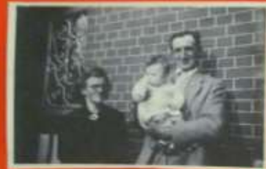
Mamie, Papi, Petit, Maman et Papa

Mamie et Papi, Mamie et Papi, Mamie et Papi, Mamie et Papi