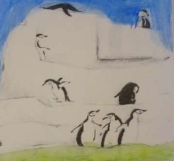
Roy et Silo sont deux papas manchots inséparables.