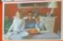
Mamie et leur mamie